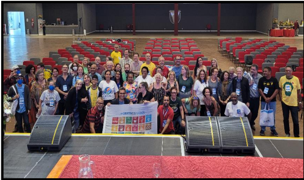
Foto: Encerramento X ECOB